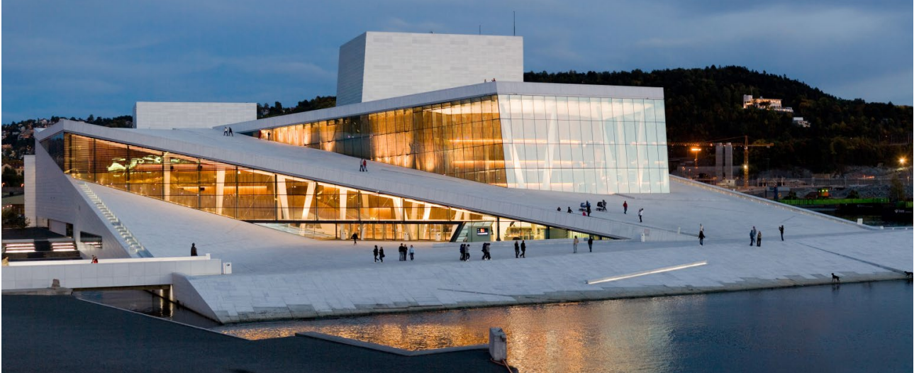
Bild 4. Das Opernhaus Oslo bei Nacht