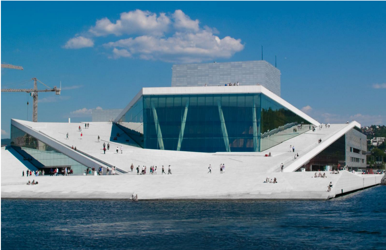
Bild 1. Das Opernhaus Oslo mit öffentlich begehbare Dachfläche

Ort des Geschehens ist der am Fjordufer gelegene Stadtteil Bjørvika, durch den ursprünglich große Straßen und Eisenbahnlinien verliefen und in dem Containerhäfen den Zugang zum Wasser versperrten. Der Bau von Büros und Wohnungen sowie diversen Kultureinrichtungen soll das Gebiet nun wiederbeleben. Ausgangspunkt ist die neue Oper, die nach 56 Monaten Bauzeit im April 2008 eröffnet wurde und seitdem als Solitär im Hafenbecken liegt. Ein neuer Tunnel unter dem Fjord befreit das gesamte Areal vom Durchgangsverkehr und schafft neben dem Operngebäude Raum für eine Uferpromenade. Dahinter erheben sich imposant die langen und schmalen, von namhaften Architekten entworfenen Hochhäuser des Barcode und verleihen dem Stadtteil eine eindrucksvolle Silhouette.