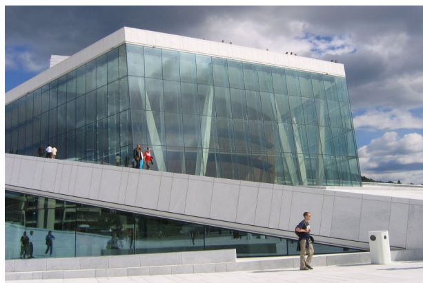
Bild 3. Schillernde Glasfassade des Foyers