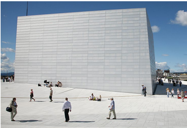
Bild 5. Kubus aus Aluminium-Paneelen