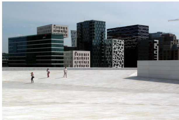
Bild 2. Blick vom Operngebäude auf die Hochhäuser des Barcode

Die Idee für das Haus der Norwegischen Staatsoper entstammt der Schiede des Osloer Architektenteams Snøhetta, das im Juni 2000 den vom norwegischen Parlament ausgerufenen internationalen Wettbewerb für sich entscheiden konnte und für seinen Entwurf 2009 mit dem Mies van der Rohe Award sowie 2010 mit dem European Prize for Urban Public Space ausgezeichnet wurde. Architektur als Metapher für eine Landschaft, bildhaft und assoziativ. Die geneigten, aus edlem Carrara-Marmor gefertigten Dachflächen haben so gar keine Ähnlichkeit mit einem gewöhnlichen Bauwerk, sondern wecken eher den Eindruck einer frei auf dem Meer treibenden Eisformation.