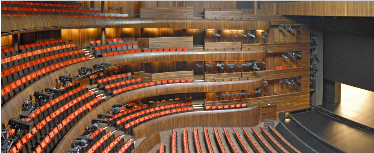
Bild 7. Der hufeisenförmige Große Saal

Verwaltung und Werkstätten liegen im Ostteil des Gebäudes. Nur teilweise von der Dachlandschaft überdeckt, gehen hier täglich 600 Mitarbeiter ein und aus. Die Fassade aus Aluminium-Paneelen wirkt edel und ästhetisch. Ein Wechselspiel aus konkaven und konvexen Formen verleiht ihnen je nach Lichtintensität variierende Eindrücke und erscheint hell oder dunkel und schillernd oder matt. Inspiriert von alten Webarbeiten wurde dieses Muster entwickelt und verleiht der Architektur des Opernhauses eine beeindruckende Wirkung.