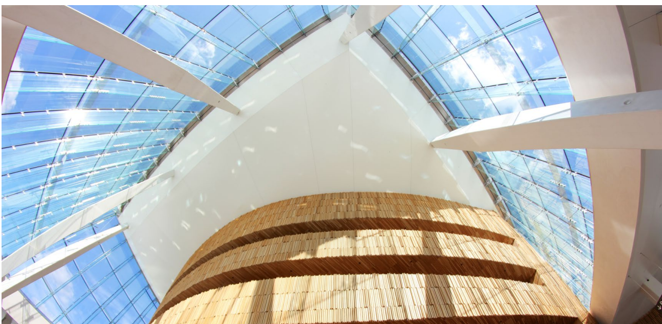
Bild 8. Wand aus Eichenholz mit Blick durch die Glasfassade des Foyers