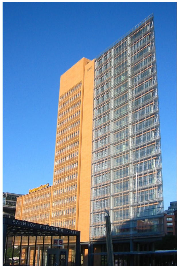
Renzo Piano 11 (Andreas Steinhoff, Wikipedia)

Der Kontrast zu den beiden Gebäuden rechts und links ist markant, denn der sogenannte Renzo Piano 11 besticht durch eine gläserne Fassade, die Spitze des Gebäudes zeigt genau auf den Potsdamer Platz, vermittelt dadurch eine faszinierende Präsenz. Die Gesamtfläche von 20.000 m 2 verteilt sich auf 19 Geschosse und eine Gesamthöhe von ca. 70 m.