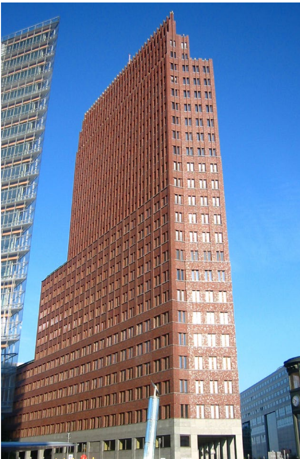
Der Kollhoff-Tower (Andreas Steinhoff, Wikipedia)

In den 90er Jahren konnte man auf der nunmehr größten Baustelle Europas die Entstehung architektonischer Besonderheiten beobachten. Ein komplettes Stadtviertel wurde neu konzipiert und so umgesetzt, dass kulturelles, wirtschaftliches und privates Leben zusammenpassen und ein zeitgemäßes Ambiente ausstrahlen. Unter der Hauptleitung von Renzo Piano entstanden wie bereits erwähnt 19 neue Gebäude, entworfen von unterschiedlichen Architekten, so dass ein insgesamt buntes und abwechslungsreiches Bild entstanden ist.