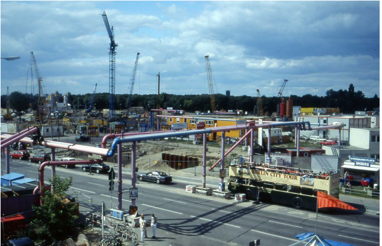
Baustelle Potsdamer Platz 1996.