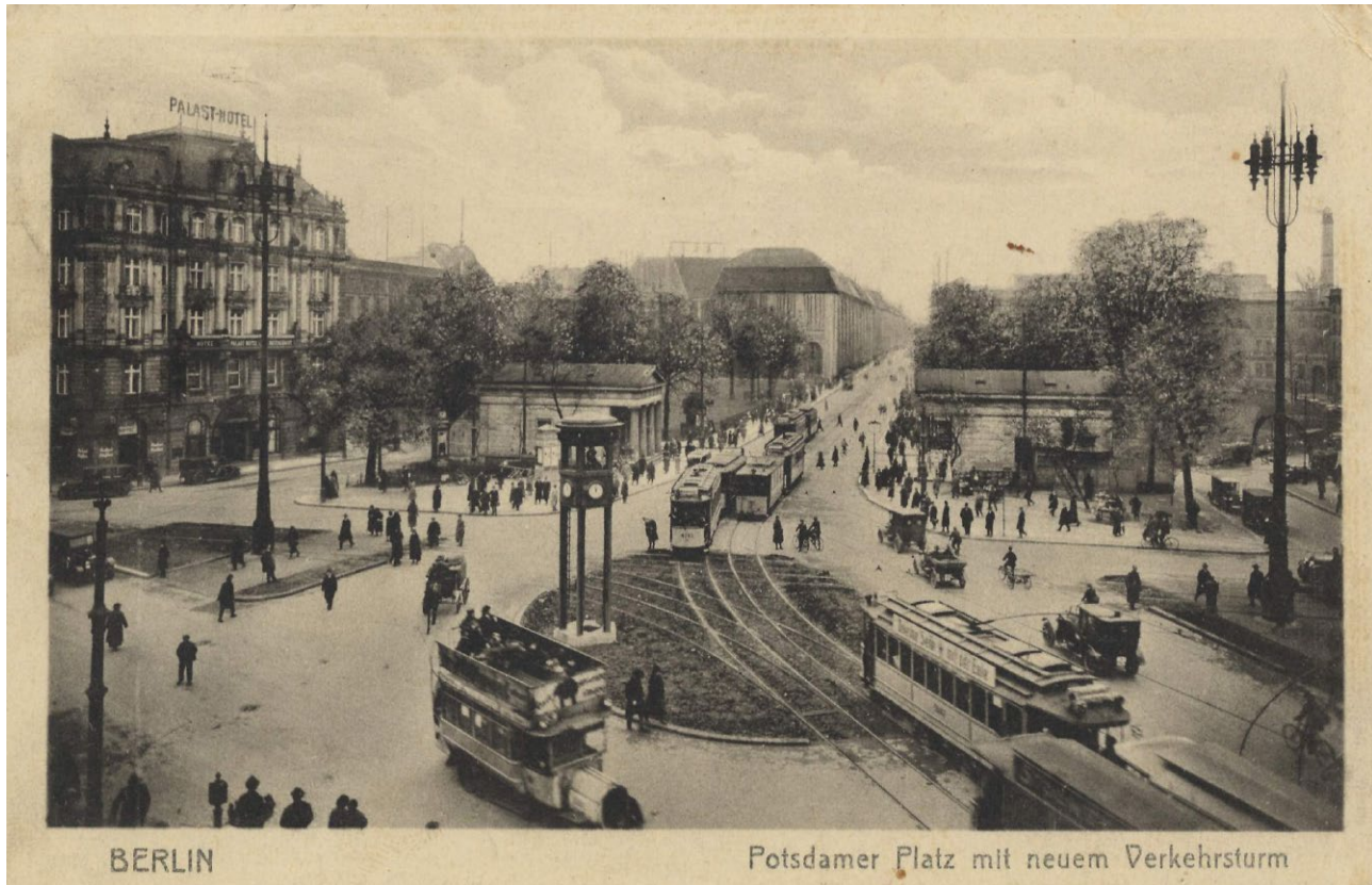
Potsdamer Platz mit neuem Verkehrsturm. Ansichtskarte von 1925.

Das Versionslogo der mb WorkSuite ist erstmalig in der Reihe unserer versionsbegleitenden Logos ein Platz in seiner Gesamtheit, kein einzelnes Gebäude. Mit der mb WorkSuite 2014 beginnen wir eine Serie, die wir in den nächsten Jahren weiterführen möchten – kaum ein Ort könnte für den Start geeigneter sein als der Potsdamer Platz in Berlin.